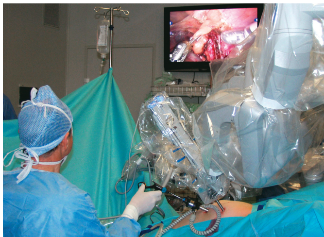
Obr. 1 CRCH v Masarykově nemocnici v Ústí nad Labem

Sledovali jsme věk pacientek, jejich váhu, délku operace, typ operace, krevní ztrátu, komplikace, základní diagnózu a u lymfadenektomií počet získaných uzlin.